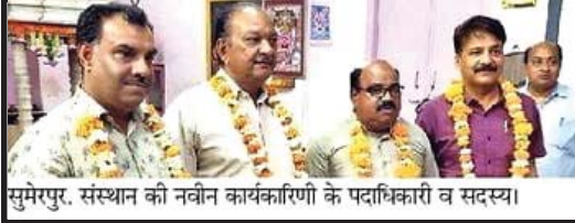
सुमेरपुर. संस्थान की नवीन कार्यकारिणी के पदाधिकारी व सदस्य।

श्री ब्राह्मण स्वर्णकार सेवा संस्थान - सुमेरपुर जि. पाली की बैठक संस्थान के चुनाव हेतु एक मार्च रविवार को शहर के